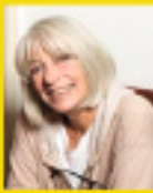
Erika Pluhar 76